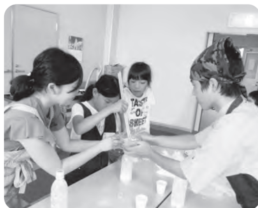
みんなでピザ生地づくり (子どもサロン事業)