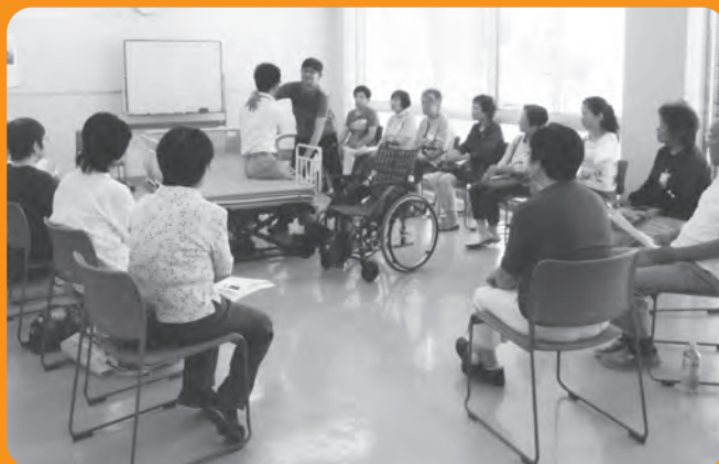
ヘルパーさんに介護技術を学ぶ

介護技術や健康づくりなどの知識を得る場として、また、介護者同士で悩みやアイデア、体験を共有する場として開催することで、介護をされている方の負担を軽減し、自宅での生活が継続できるようお手伝いします。