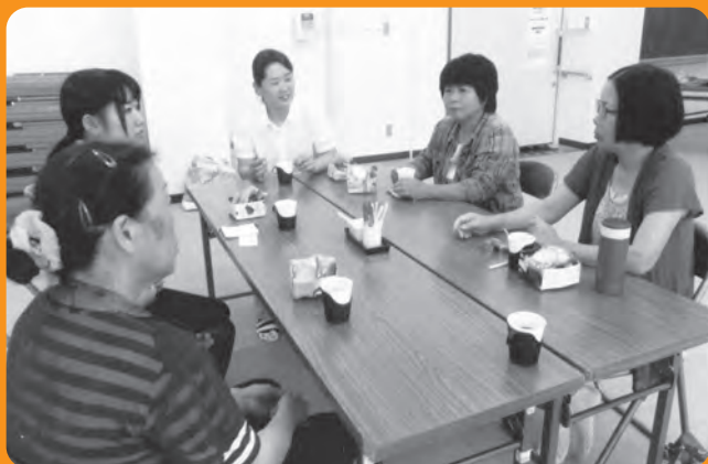
参加された方とお茶を飲みながらの交流