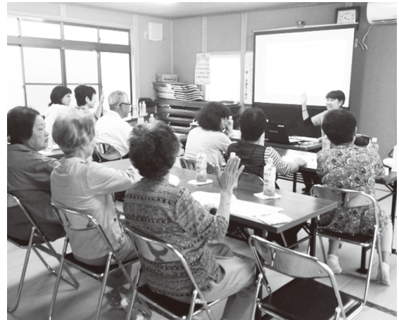
戸郷のサロンで、「発達障害」の発表中