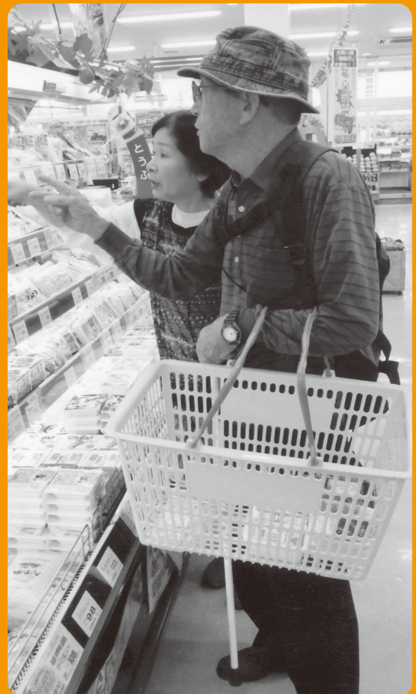
住民による支えあい活動

この先5年、10年後を見据え、住み慣れた地域で自分らしく、安心して住み続ける。今ある支えあい活動を大切にしながら、自治振興区・行政など様々な団体と連携し、それぞれにあった地域づくりを進めます。