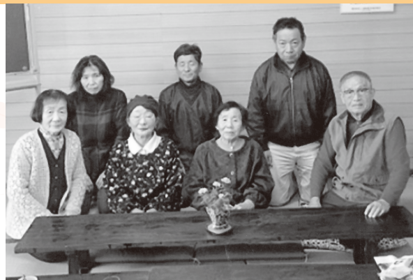
近隣サロンと交流会

集金常会を夜から昼にしたことをきっかけに、「夫婦でも参加できる集まり場を」との声が上がり、平成24年に立ち上がりました。茶話会に加え、男性も気軽に参加できるようにと新年会や泥落とし、大掃除など様々な行事をサロン活動に組み込んでいます。