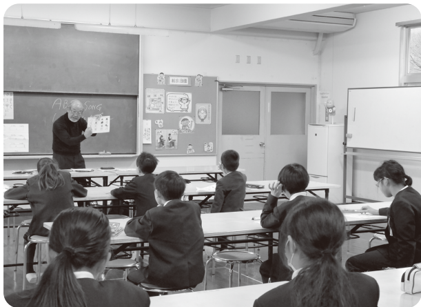
いいやま子ども塾