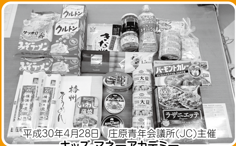
平成30年4月28日 庄原青年会議所(JC)主催 キッズマネーアカデミー