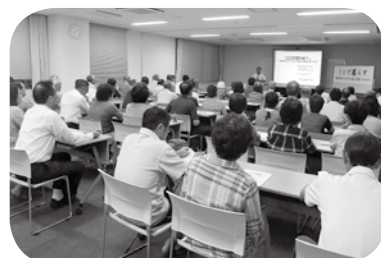
「お隣さん運動講演会」の様子