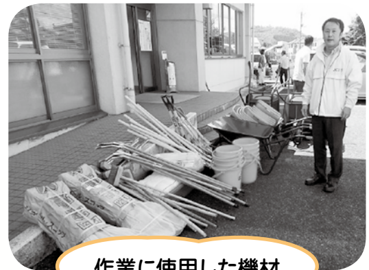
作業に使用した機材