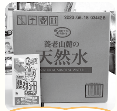
熱さまシートと飲料水